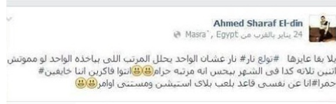
المدعو أحمد شرف الدين .. معدوم الشرف والدين الشهير ببسكوتة هذا المجرم من قرية شبرا النخلة - مركز بلبيس - محافظة الشرقية