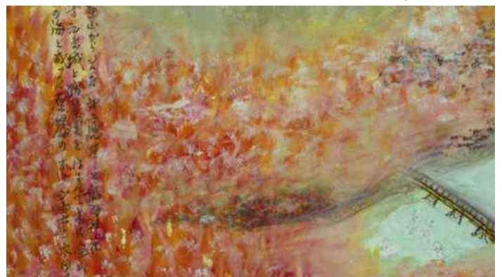
جثث ابتلعتها مياه النهر: