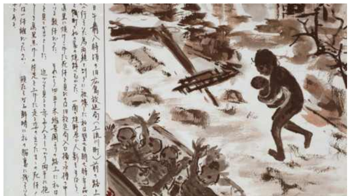
خراب في المدينة: